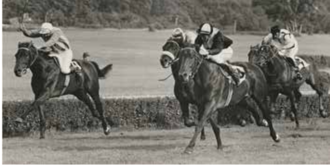
Weidenpescher Rennbahn, Union-Rennen, 100 Meter vor dem Ziel, 9. Juni 1968