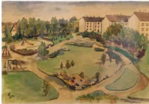
Erich Linke, Spielplatz im Weidenpescher Park, gesehen aus dem Haus Rennbahnstraße 22, 1953, Aquarell / Sammlung Walter Runge, Köln