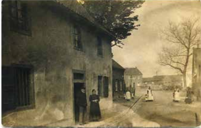
Blick in die Hubertstraße, ca. 1909/1910. Die Straße wurde am 9. April 1913 in Amboßstraße umbenannt. Links vorne das Haus Hubertstraße 13, daneben zurückgesetzt das Haus Nr. 15. Im Hintergrund die Häuser Jesuitengasse 35.

Der Blick in die Geschichte zeigt das Gegenteil. Es gibt hier mehr als die Rennbahn. Über 300 Bilder, Karten und Grafiken, viele davon bisher unveröffentlicht, berichten vom Leben in der Vergangenheit. Sie zeigen Straßen, Häuser, Kirchen, Vereine, Läden, Betriebe, Gewerbe, Industrie und Institutionen, die teilweise längst vergessen sind.